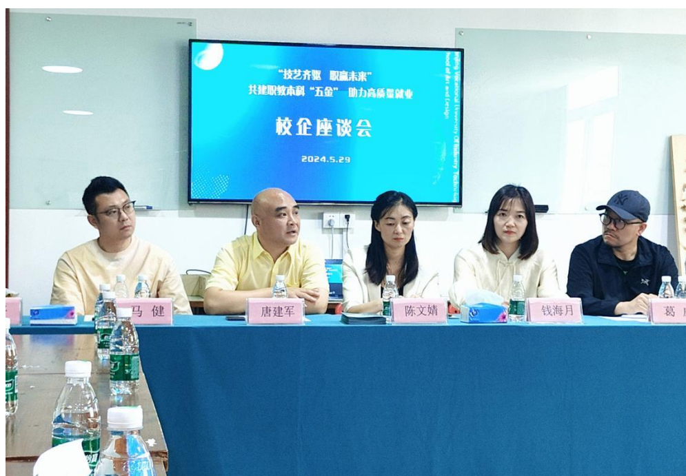
图 8 公司总经理受邀参加环境设计系师生座谈

中建装饰派遣资深室内设计师参与专业综合实训授课以及到校进行师生座谈，将实际工地现场所遇到的专业技术及关注点与学生分享，学生在校就可以与工地现场“零距离”接触，获得学生极大的好评。（图 8）