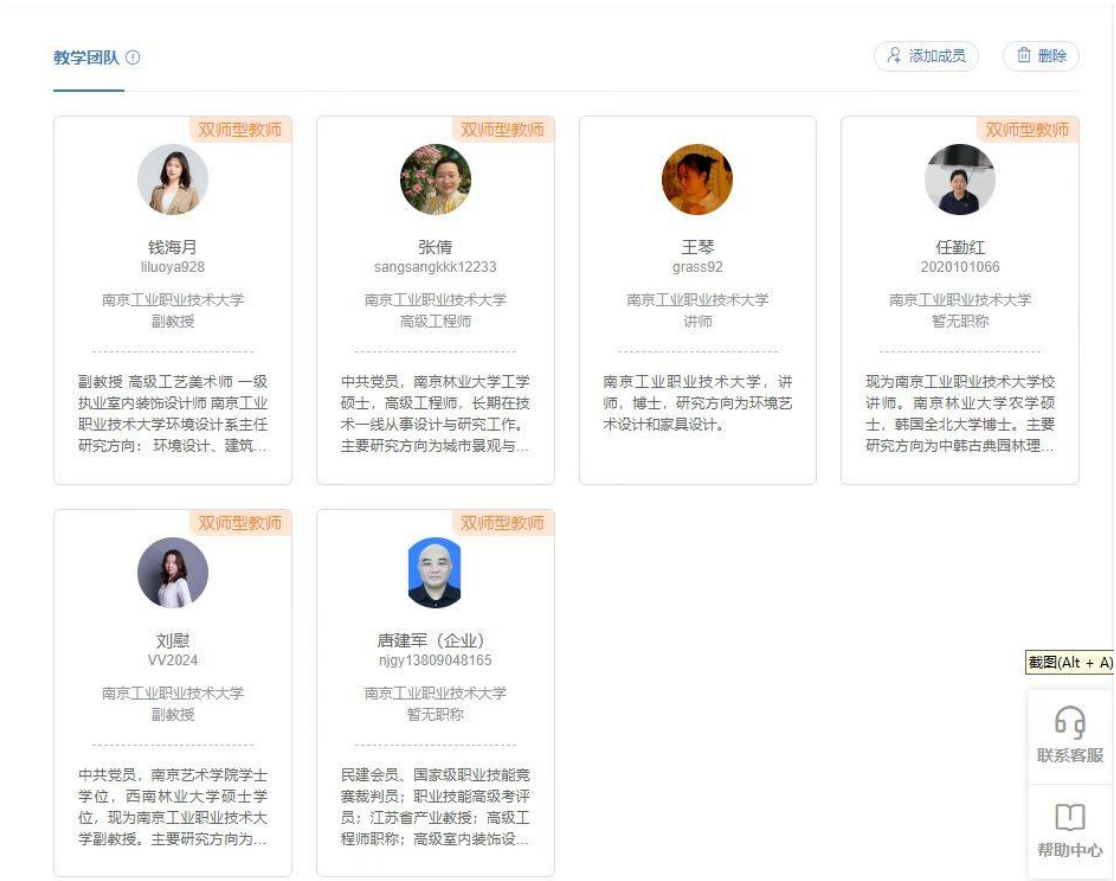
图 6 中建公司参与课程团队建设

中建装饰与我校老师一起参与了环境艺术设计专业本科人才培养体系、实验实训课程标准、综合设计项目实施流程及规范体系等文件制定，参与本科课程团队建设工作。（图 6）