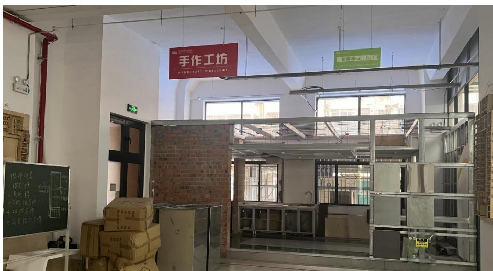
图 5 手作工坊以及施工工艺展示建设

南京工业职业技术大学与中建装饰校企合作共建手作工坊的施工工艺展示区项目，鼓励师生多参与动手实践，衍生更多的专业人才培养成果。（图 5）