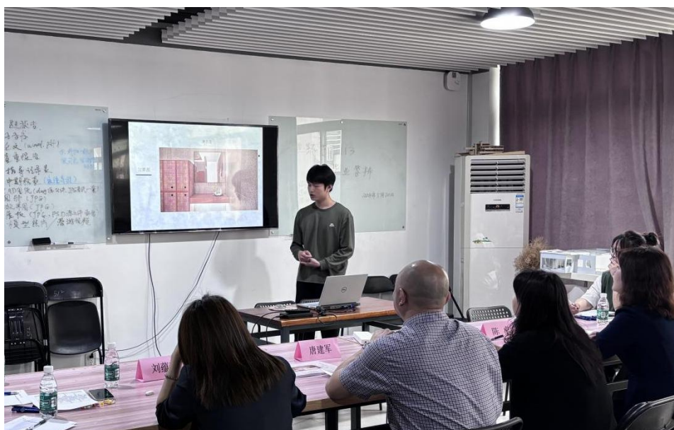
图 7 校企合作项目设计作品汇报场景

中建装饰派遣资深室内设计师参与专业综合实训授课以及到校进行师生座谈，将实际工地现场所遇到的专业技术及关注点与学生分享，学生在校就可以与工地现场“零距离”接触，获得学生极大的好评。（图 8）