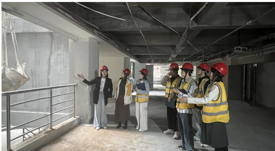
图 3 师生在公司一线工地实践